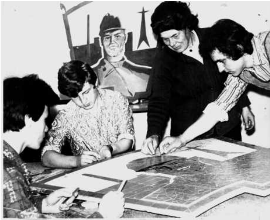
1973 . . .